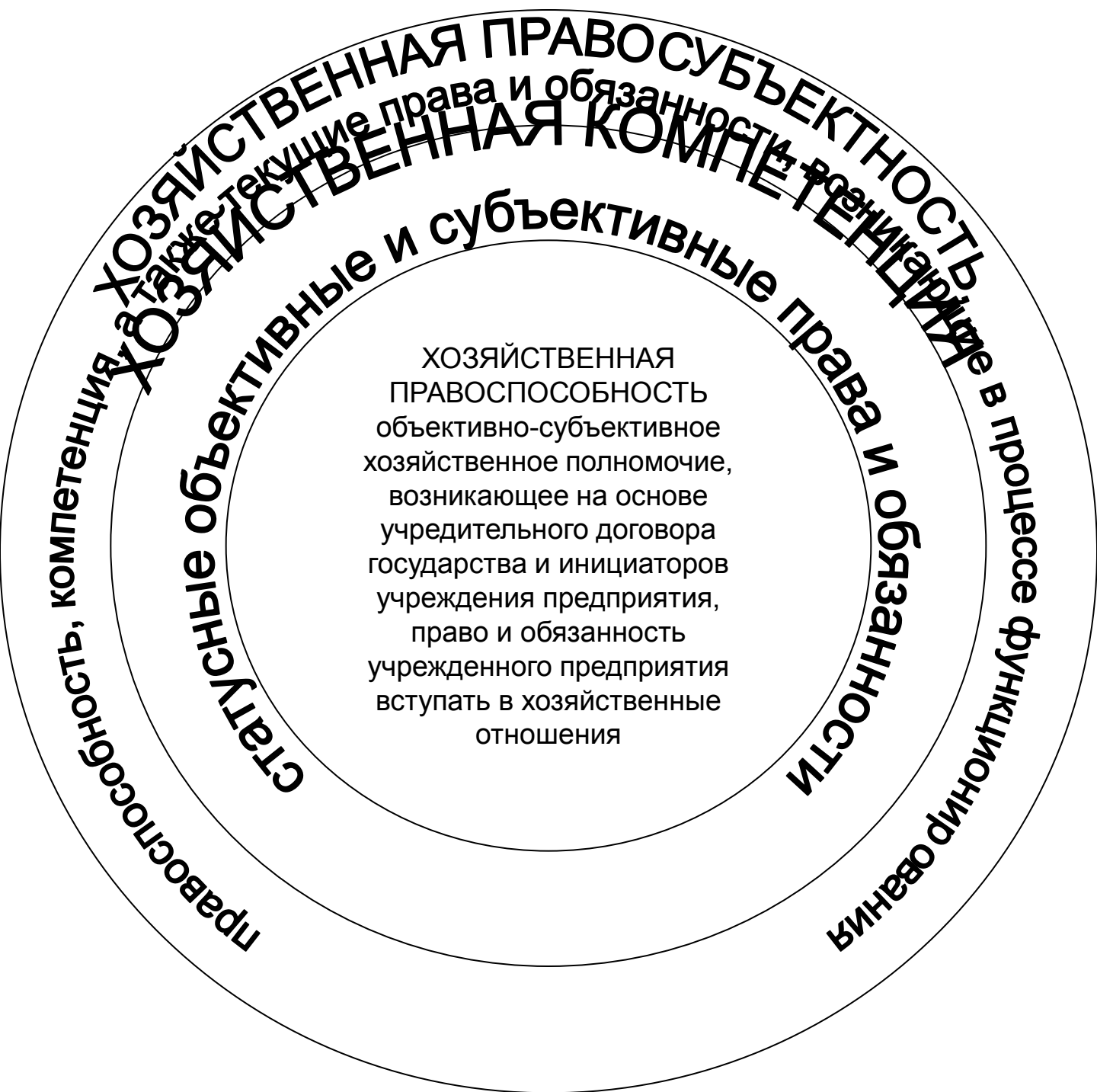
Рис.3. Соотношение понятий хозяйственной правоспособности, компетенции и правосубъектности предприятия