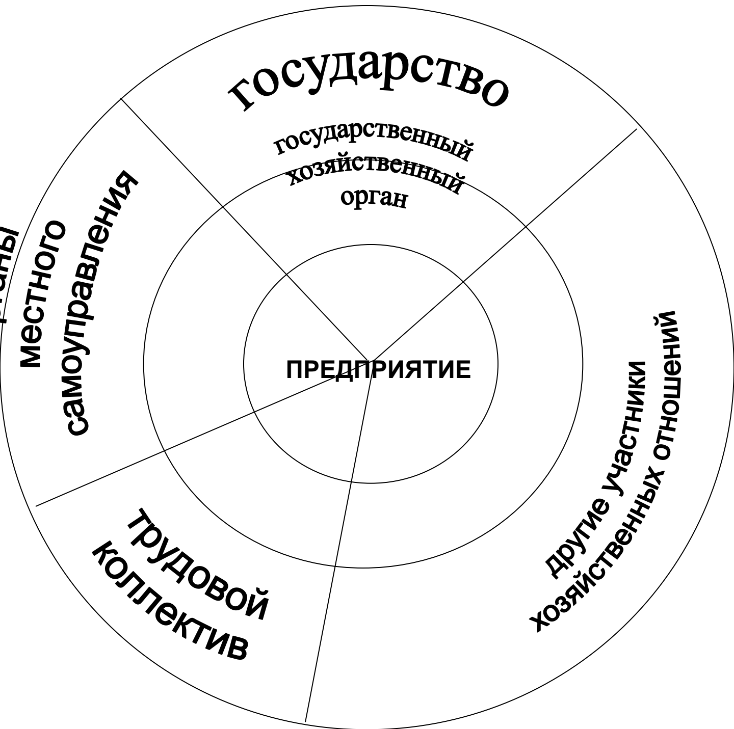
Рис. 6. Структура предприятия как правового института