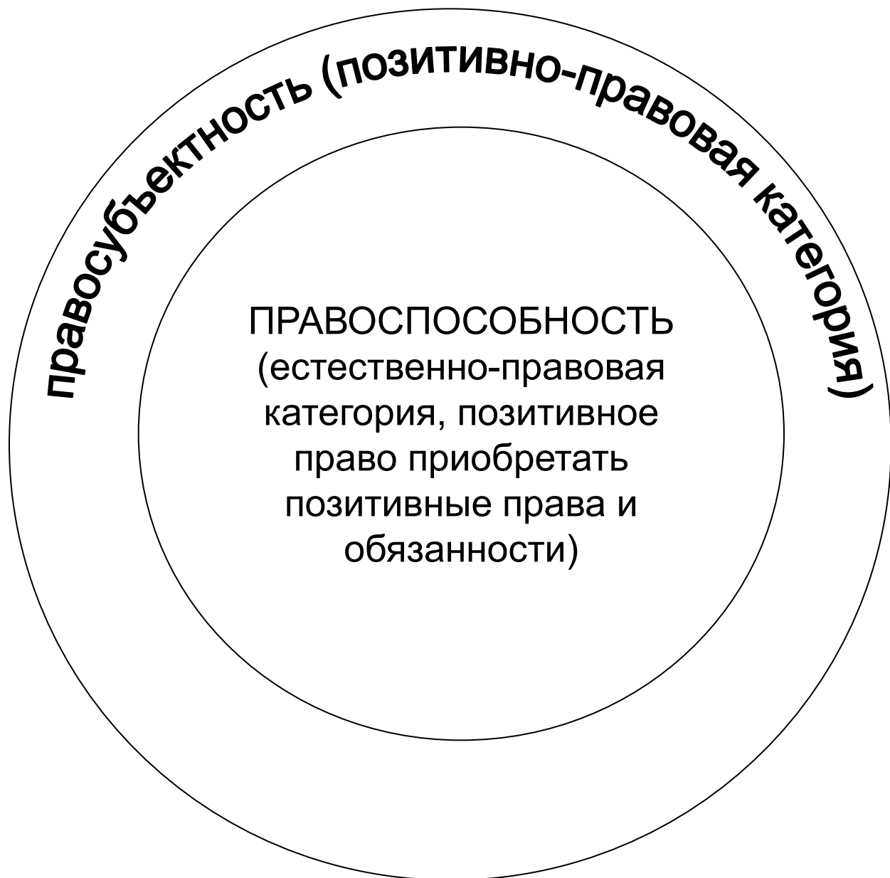
Рис.2. Соотношение правоспособности и правосубъектности