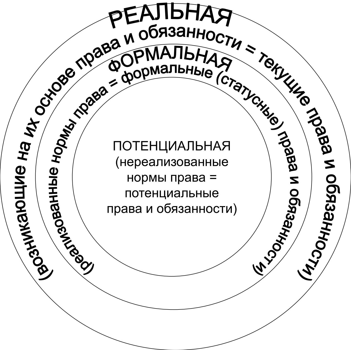
Рис.4. Классификация хозяйственной правосубъектности по соотношению нормативного регулирования и правореализации